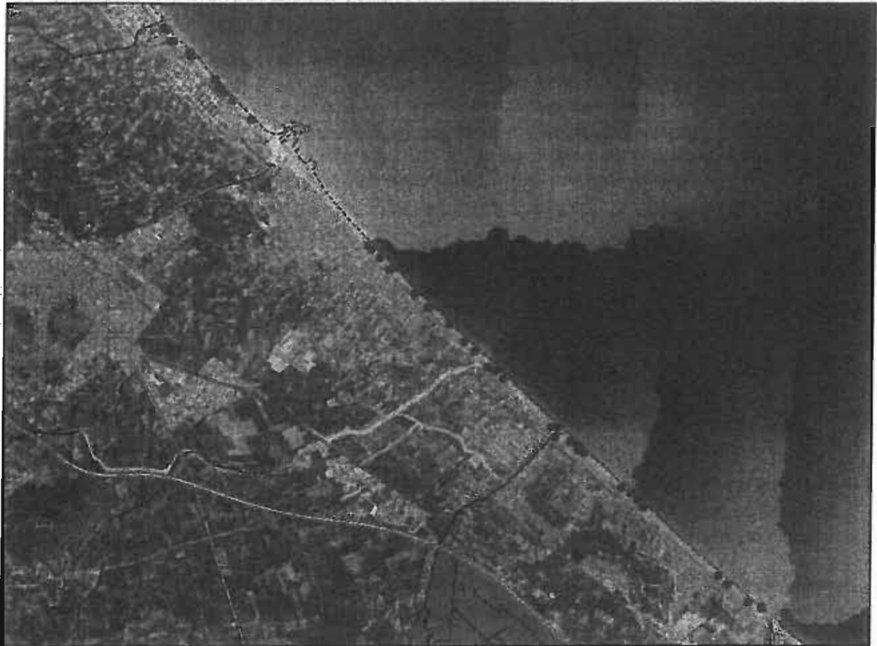
Fig 1.- Situación de los territorios de Chorlitojo patinegro (nidos, pollos y/o adultos observados) en las playas de Oliva durante las estaciones reproductoras de 2013 y 2014.

Por otra parte, la franja litoral comprendida entre el Riu del Vedat y el Riu Molinell es igualmente un espacio de alto valor medioambiental, con presencia habitual de ejemplares reproductores de la especie. Es por ello que este tramo de playa cumple un importante papel como área de recolonización natural para el chorlitojo patinegro, siendo recomendable que continúe manteniendo su grado de conservación actual.