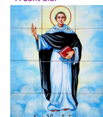
9. Sant Vicent Ferrer