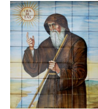
1. Sant Francesc de Paula