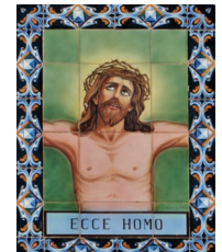
4. Ecce Homo