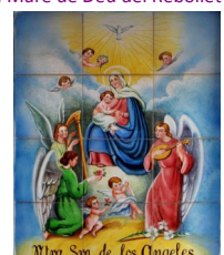
10. Mare de Déu dels Àngels