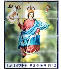
2. La Divina Aurora