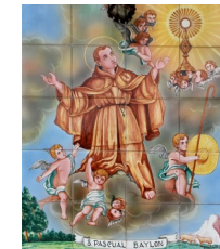
3. Sant Pasqual Bailón