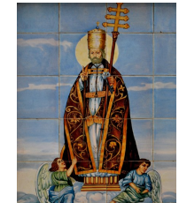
6. Sant Pere Apòstol