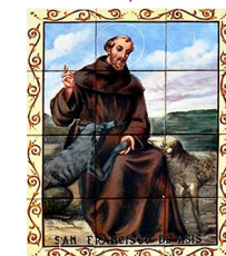
5. Sant Francesc d'Asís