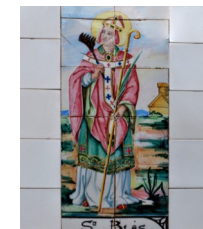
7. Sant Blai