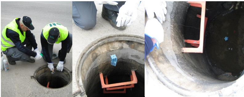
Instalación de un punto de control en un pozo de Alcantarillado

Colocación de cebos rodenticidas en formato de bloques parafinados colgados sobre pozos. El tratamiento se realiza en todos los pozos de cruces de calles o cada 6-8 trampas en avenidas o calles largas.